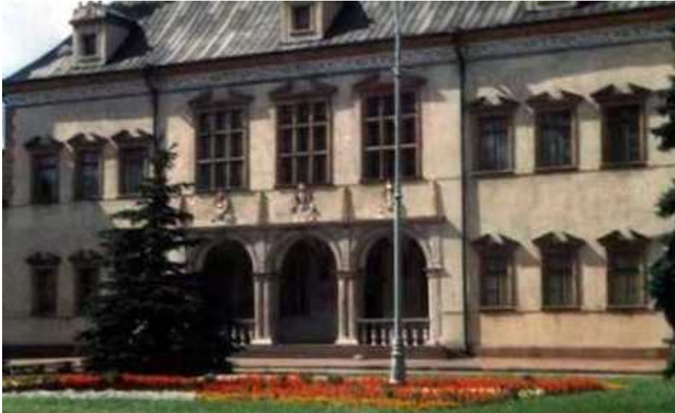
Rysunek 13. Pałac Biskupi w Kielcach.

Muzeum Narodowe: muzeum wewnątrz pałacowych, sanktuarium Marszałka Józefa Piłsudskiego, zbiory malarstwa polskiego XVIII i XIX wieku (J. Chełmoński, J. Fałat, A. Gierymski, J. Kossak, J. Malczewski, S.I. Witkiewicz, L. Wyczółkowski, S. Wyspiański).