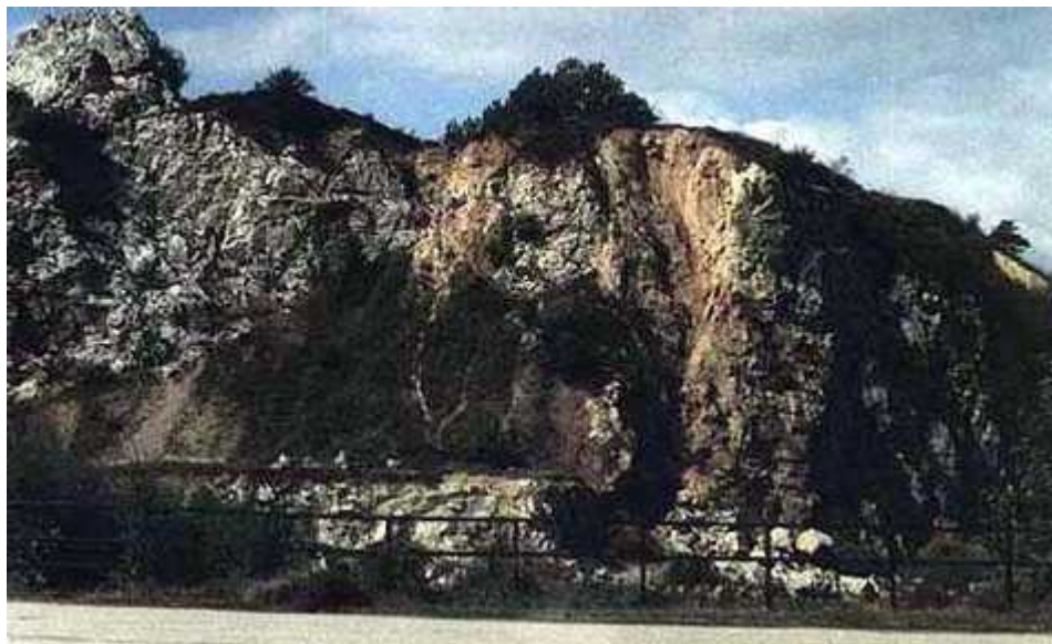
Rysunek 15. Kadzielnia

Przez około 100 lat pozyskiwano tu na skalę przemysłową wapienie dewońskie. W latach 60-tych przerwano eksploatację urządzając na wzgórzu tereny rekreacyjne. Oprócz alejek spacerowych, punktów widokowych, toru saneczkowego, z okazji obchodów IX wieków miasta oddano do użytku w 1974 roku amfiteatr na 5000 miejsc siedzących.