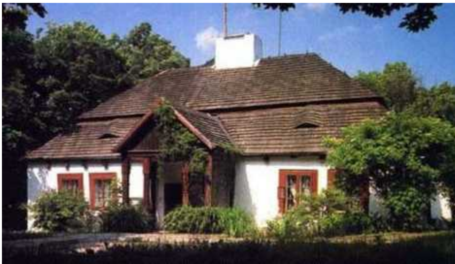
Rysunek 14. Dworek modrzewiowy w Kielcach.

Dworek modrzewiowy (XVIII w.) – kryty łamanym dachem gontowym. Ma w nim swą siedzibę Muzeum Wsi Kieleckiej, które zlokalizowane jest w Tokarni.